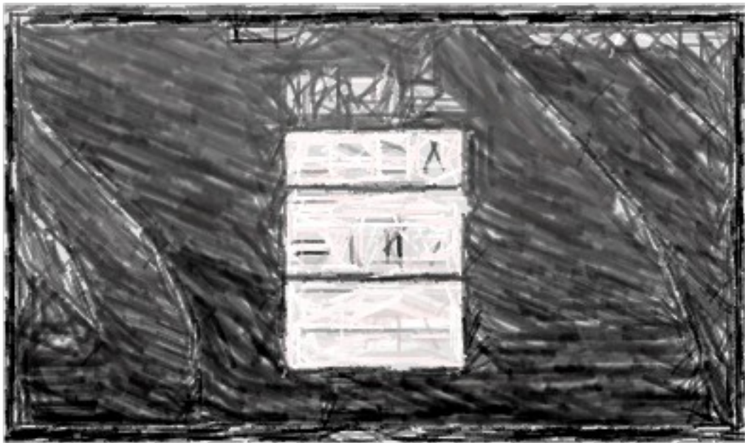
Smartboards – ADVANTouch